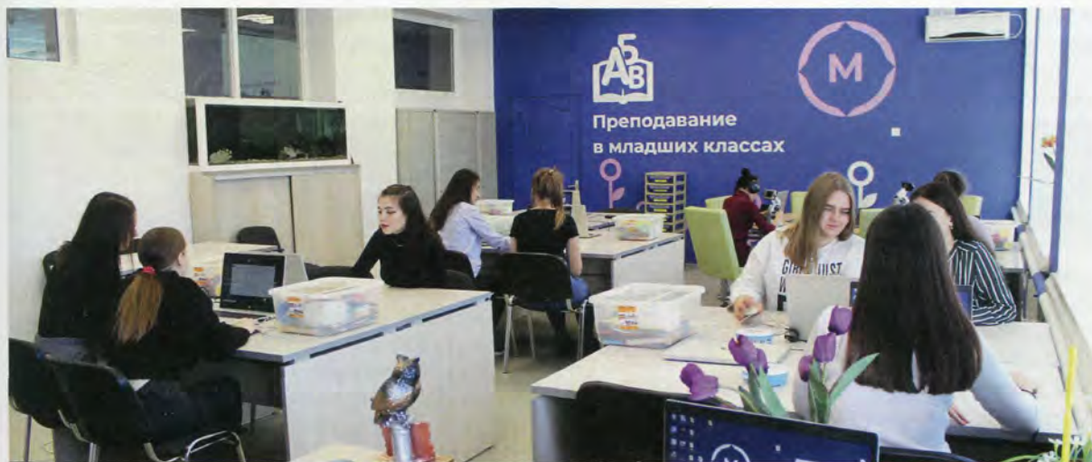
Мастерская «Преподавание в младших классах»

Совместно с МАДОУ №78 «Семицветик» апробирована инновационная форма ранней профориентации детей дошкольного возраста BabySkills – чемпионат рабочих профессий в миниатюре для дошкольников.